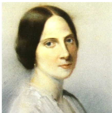
Un ritratto giovanile di Teresa Filangieri