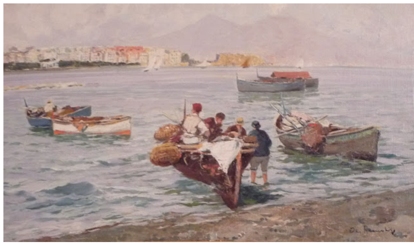
"Pescatori sulla Spiaggia di Napoli" Elvira Raimondi

Fuori una Napoli uscita dal dominio borbonico, cerca disperatamente una annessione, non solo geografica, ad un'Italia dimentica delle offerte promesse, una Napoli che confonde il sacro e il profano, divisa tra cielo e terra, dove gli angeli muoiono e i diavoli si redimono, dove i profumi delle belle dame e la bellezza del mare si mescola per le strade al sangue e agli escrementi di uomini e bestie e un popolo lazzarone trascinato tra colpe e grazie.